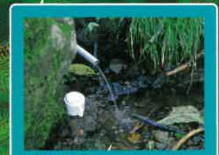
弘法清水 小さな流れの水場。