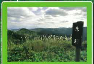
赤剥 眺望が広がるビューポイント。